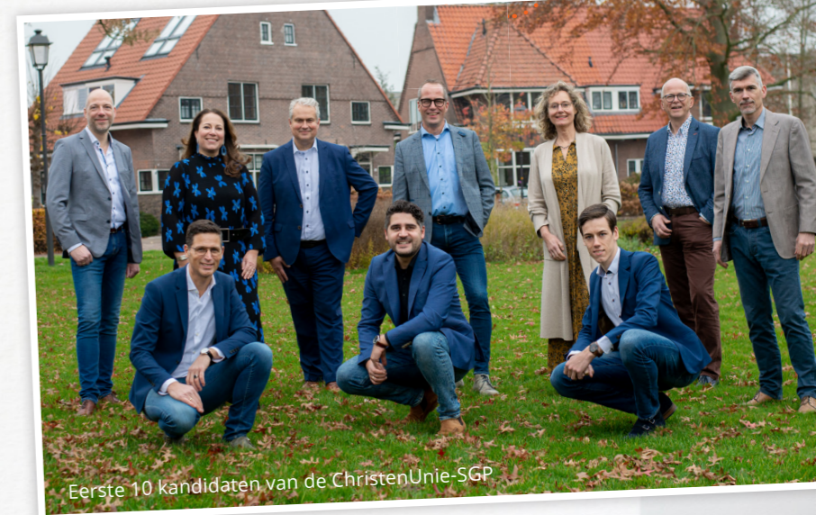
Eerste 10 kandidaten van de ChristenUnie-SGP

PS. Ons verkiezingsprogramma heet 'Voor elkaar?! Samenleven in vertrouwen'. Lees er meer over op pagina 8 en 9.