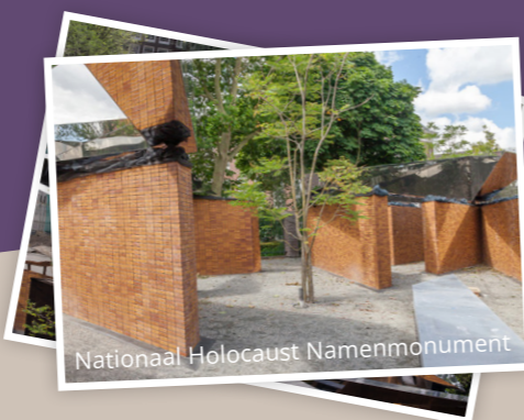
Nationaal Holocaust Namenmonument

Als ChristenUnie-SGP vinden wij het belangrijk dat wij als gemeente Nijkerk onze weggevoerde Joodse inwoners blijven gedenken. Door het adopteren van de stenen zorgen wij ervoor dat de namen van de 48 Joodse Nijkerkse inwoners genoemd blijven worden. Om de stenen te realiseren hebben wij samen met het CDA een motie ingediend die door de hele gemeenteraad is overgenomen.